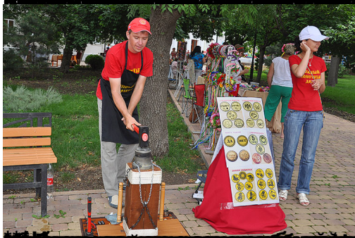
Морской узел - 2015. Новороссийск. 06.07.2015.