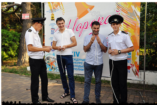
Морской узел - 2015. Новороссийск. 06.07.2015.