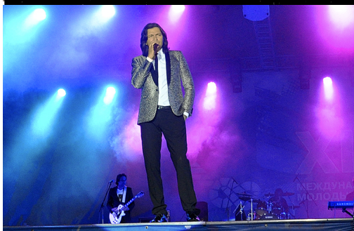
Морской узел - 2015. Новороссийск. 06.07.2015.