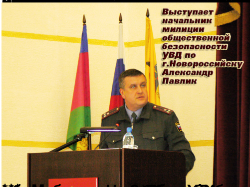
Выступает начальник милиции общественной безопасности УВД по г.Новороссийску Александр Павлик