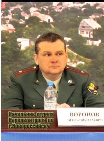
Начальник отдела Наркоконтроля по г.Новороссийску