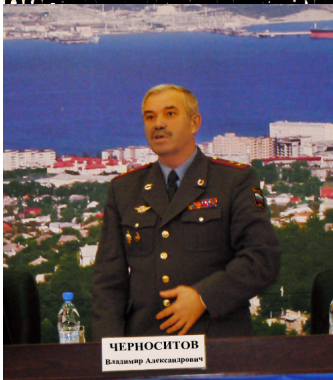
Начальник УВД по г.Новороссийску