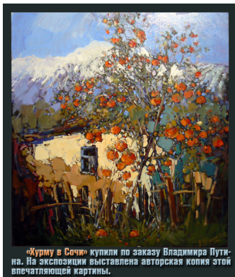
«Журму в Сочи» купили по заказу Владимира Путина. На экспозиции выставлена авторская копия этой впечатляющей картины.

Автор: Фото: Владимир ДАРКИН, Марина ЭКСТЕР, Тимур ИЗВЕСТИН 10.06.2011 22:49