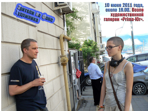
10 июня 2011 года, около 19.00. Возле художественной галереи «Prima-Yu».