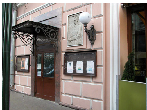
Государственный музей - гуманитарный центр "Преодоление" имени Н.А. Островского на ул.Тверской