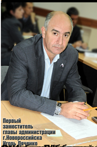
Первый заместитель главы администрации г.Новороссийска Игорь Дяченко