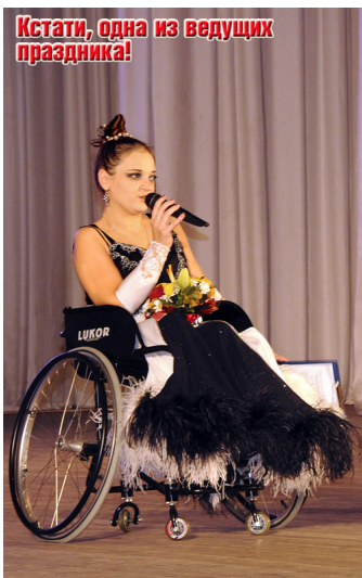
Кстати, одна из ведущих праздника!

Автор: Текст и фото: Юлия КОНДРАТЬЕВА 03.12.2012 23:02