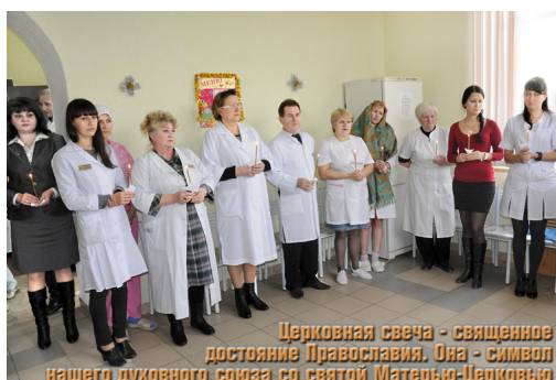
Церковная свеча - священное достояние Православия. Она - символ нашего духовного союза со святой Матерью-Церковью