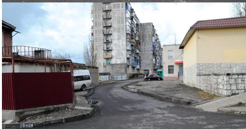
Ул. Мефодиевская, проезд к домам 118 и 120