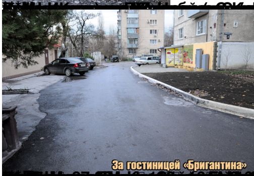
За гостиницей «Бригантина»