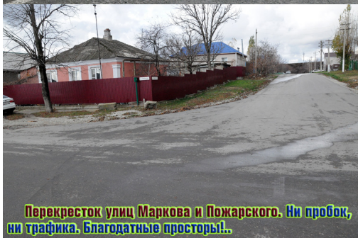
Перекресток улиц Маркова и Пожарского. Ни пробок, ни трафика. Благодатные просторы!..