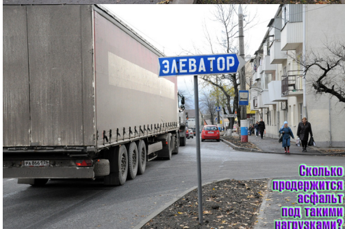
Сколько продержится асфальт под такими нагрузками?