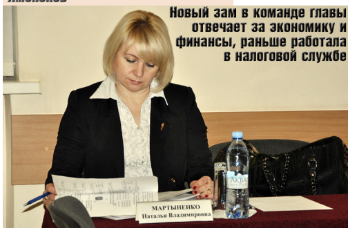
Новый зам в команде главы отвечает за экономику и финансы, раньше работала в налоговой службе