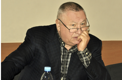
Троллейбусники недовольны долгами и сменой руководства