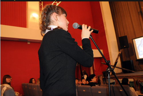
Палубный сбор патриотического клуба «Шхуна Ровесников» с молодым поколением города, руководителями, Новороссийска, ветеранами комсомола