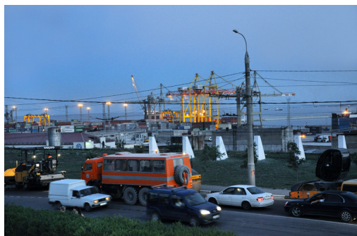
Закат где-то рядом...

Автор: Текст и фото: Марина ЭКСТЕР 22.06.2013 08:57