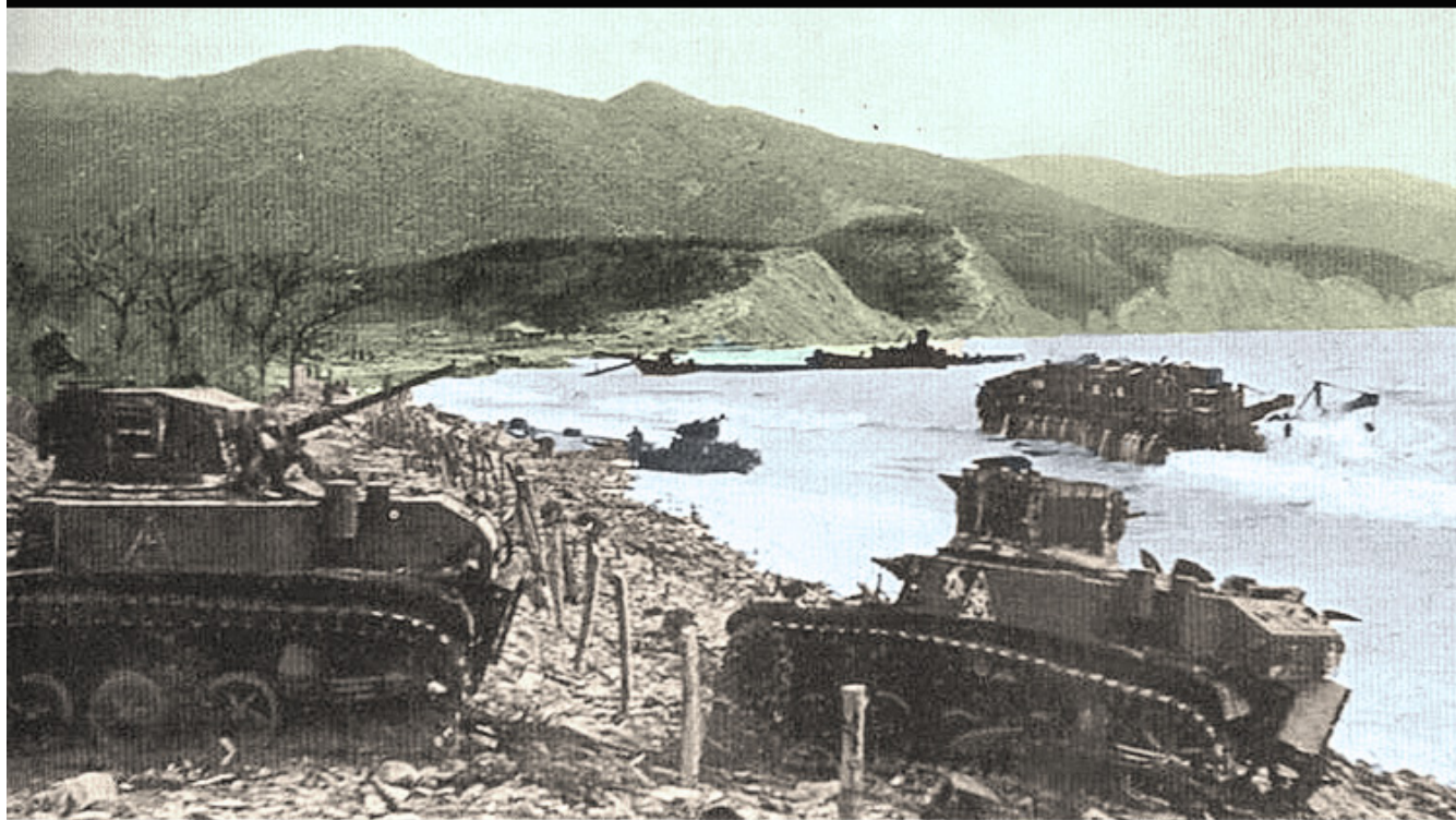
Выгрузка танков с третьего боиндера, бои на плацдарме