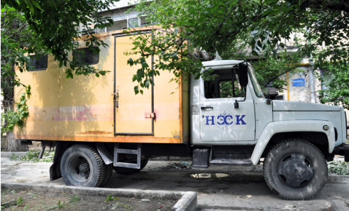
В этот раз приехало сразу две машины. Это - первая