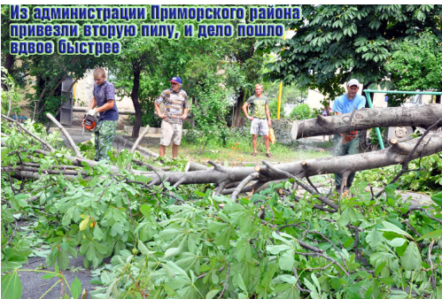
Из администрации Приморского района привезли вторую пилу, и дело пошло вдвое быстрее

Автор: Текст и фото: Марина ЭКСТЕР (кроме тех фотоснимков, где указано) 01.04.2024 21:52