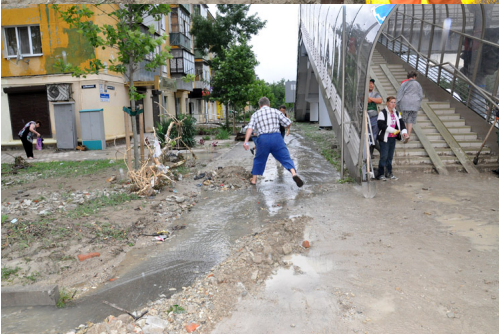
Ночью переход пользовался повышенной популярностью. По дороге текла большая вода...