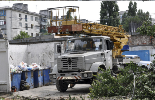
Вторая машина «НЭСКа» - вышка, и она, в отличие от мусоровоза, запросто проехала