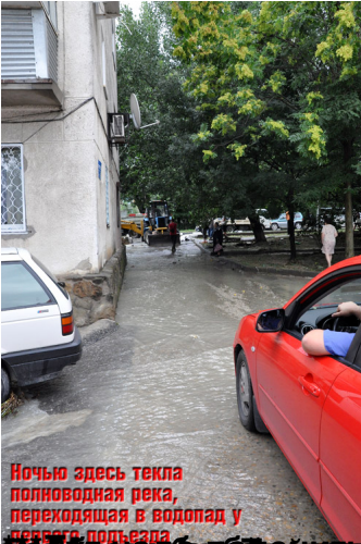
Ночью здесь текла полноводная река, переходящая в водопад у береста-подъезда

01.04.2024 21:52