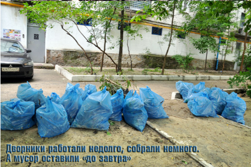
Дворники работали недолго, собрали немного. А мусор оставили «до завтра»