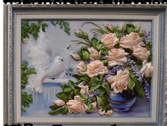
***Восхищаюсь искусством и талантом мастерицы Марины Ивановны Баккойрогони. Такое чувство, что они нарисованы. Техника вышивки этих