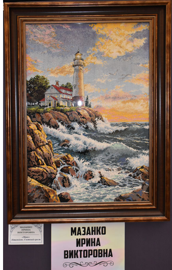
***Восхищаюсь искусством и талантом мастерицы Марины Ивановны Баккойрогони. Такое чувство, что они нарисованы. Техника вышивки этих