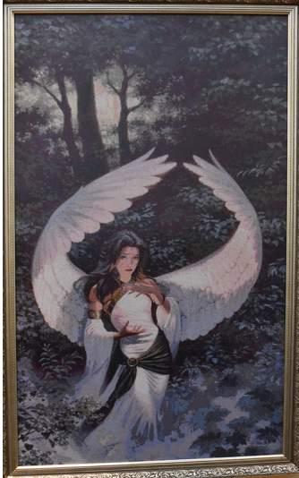
##Она работает в основном с вышивкой, и