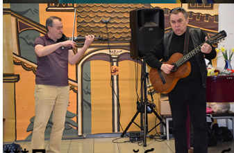
и музыканты ансамбля «Солнечный ветер» выступили с программой «Солнечный ветер».