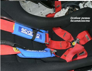
Особые ремни безопасности