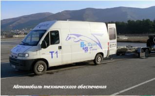
Автомобиль технического обеспечения