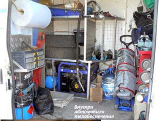
Внутри автомобиля технического обеспечения