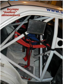
Внутри "боевого" автомобиля