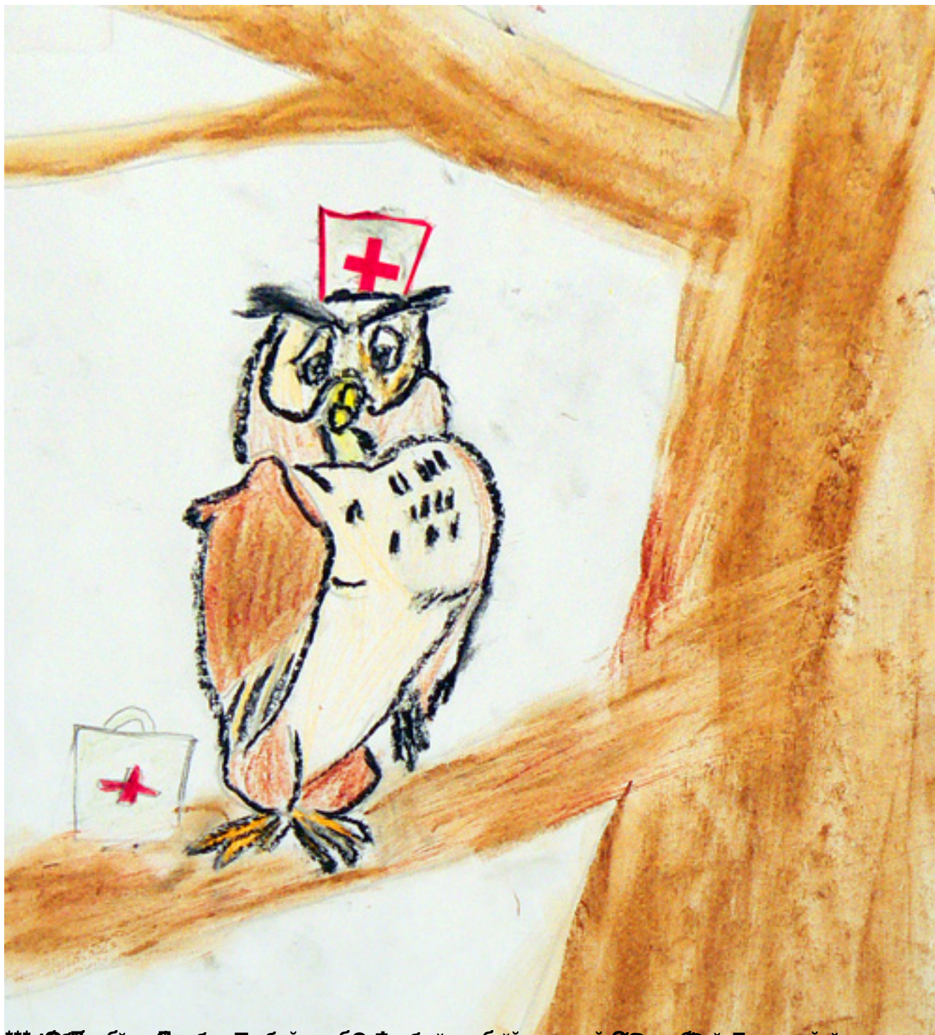
Иллюстрация: Владимир ДАРКИН

Автор: Текст и фото: Марина ЭКСТЕР. Фото, отмеченные *, предоставлены главным врачом поликлиники №5. Дизайн плаката: Владимир ДАРКИН