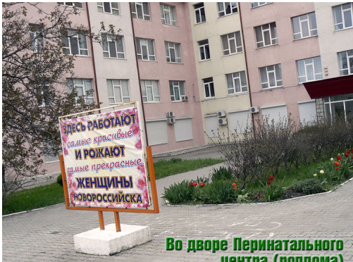
Во дворе Перинатального центра (роддома)

Автор: Пресс-служба администрации МО г.Новороссийск, Марина ЭКСТЕР (вторая часть текста и фото) 21.11.2011 18:56