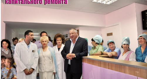
Видеоролик о работе отделения детской хирургии первой горбольницы

суммарно 401 тыс. руб., 41 млн. 179 тыс. 200 р., в т.ч.: