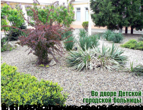
Во дворе Детской городской больницы