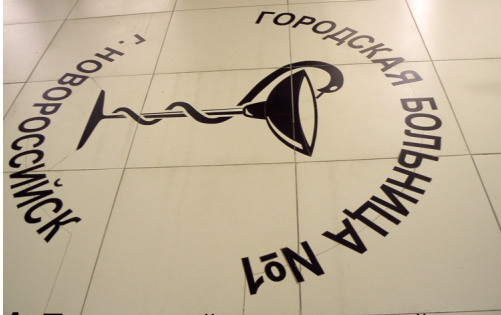
Кафель на полу в холле