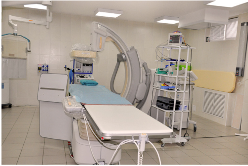
Региональный сосудистый центр - подразделение первой горбольницы - участвующие в конкурсе «Стандарты В реанимации первой горбольницы

«Стандарты оказания медицинской помощи в области «Здравоохранения» на 2012 год предусмотрено