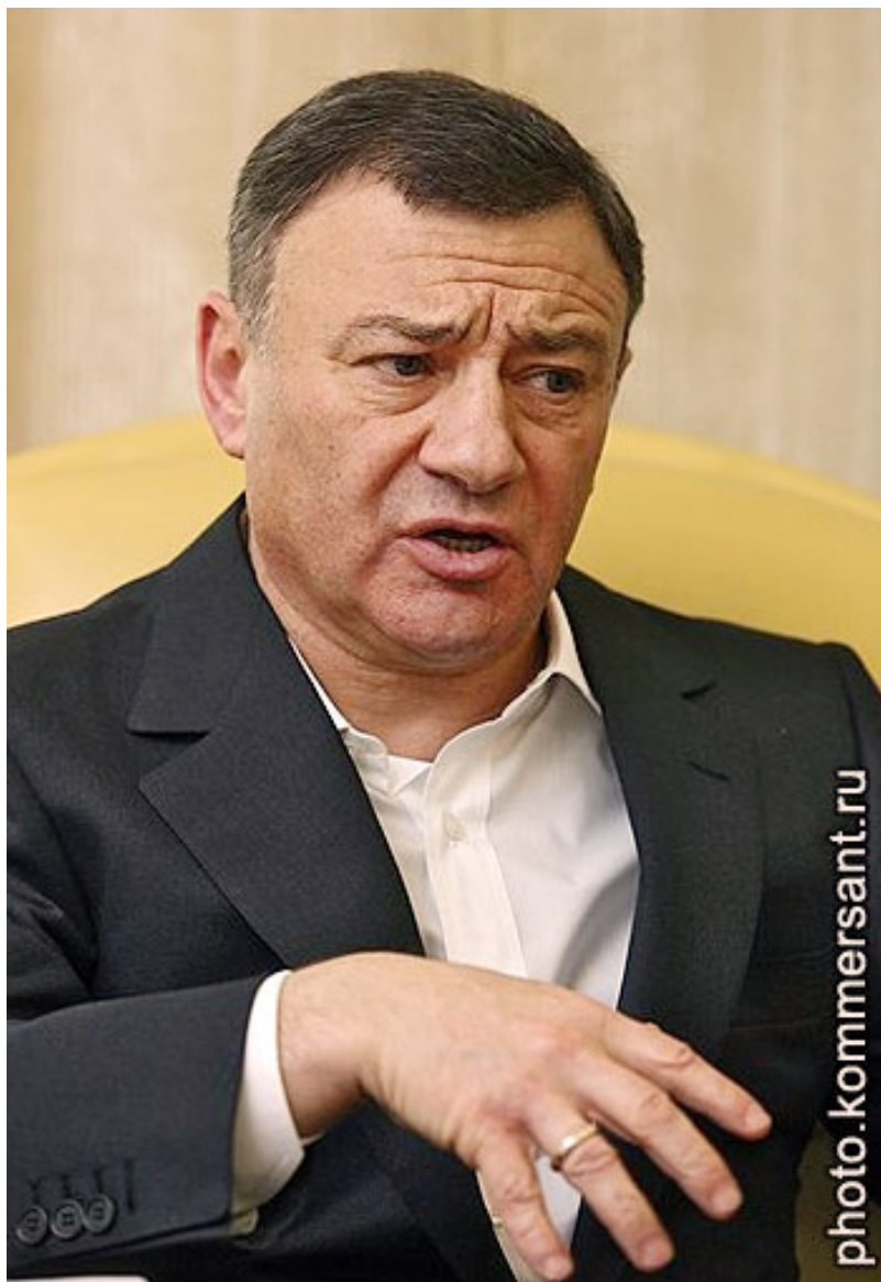
Президент спортклуба "Явара-Нева" Аркадий Ротенберг.

***Рано или поздно это должно было случиться. Государство всегда сможет сделать даже самому большому бизнесу предложение, от которого невозможно отказаться. Если сильно-сильно захочет. И, конечно, те, кто знают историю жизни и бизнес-становления таких хозяев жизни, как два контролирующих акционера Новороссийского морского торгового порта (НМТП) Александр Пономаренко и Александр Скоробогатько, всегда понимали, что их "несметные" богатства не являются пожизненной гарантией владения крупнейшим в России портовым терминалом. Третий контролирующий - Аркадий Ротенберг - человек из другой "оперы", тоже очень интересной, но и к нему это точно так же