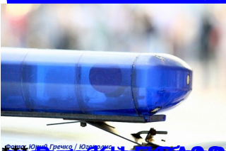
Юлия Гречес / Юра Гречес