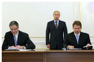
Глава Chevron Джон Уотсон (слева) отметил, что проект связан с большими геологическими рисками и затратами и он надеется на тесное сотрудничество с российским правительством.

*** Крупнейший оператор фиксированной связи на территории Южного и Северо-Кавказского федеральных округов России реорганизован в форме присоединения к ОАО «Ростелеком». За это проголосовали акционеры на годовом общем собрании ОАО «ЮТК». И это очередной важный этап реорганизации группы компаний «Связьинвест». Как ожидается, в результате реорганизации группы компаний «Связьинвест» вместо восьми операторов, предоставляющих основные услуги электросвязи населению, государственным органам и предприятиям только в границах своих лицензионных территорий, будет действовать единый универсальный оператор электросвязи, который будет предоставлять в национальном масштабе полный спектр современных телекоммуникационных услуг. Среди них – традиционные услуги - местная, междугородная и международная телефония, - и новые услуги, в частности передача данных, беспроводная связь, услуги широкополосного доступа в Интернет. Сегодня ОАО «ЮТК» – это около 4 млн. основных абонентских устройств.