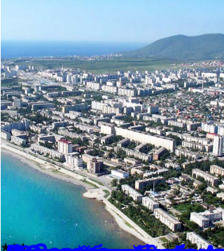
Новороссийск – замечательный курорт! Сориентироваться лучше всего по "азиатской стене" - пр. Ленина, 22

Автор: Подборку сделал Кондрат Силегнов 18.06.2010 09:09