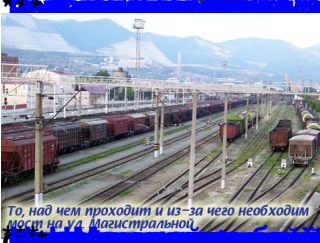
То, над чем проходит и из-за чего необходим мост на ул. Магистральной