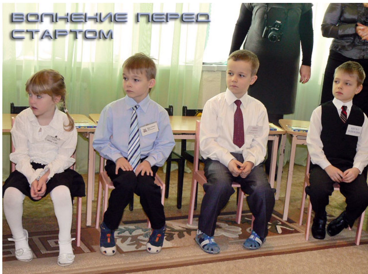
В День рождения Миссии в библиотеке пройдёт конкурс «Миссия перед стартом». Дети будут читать стихи, песни, танцевать, играть в настольные игры, три