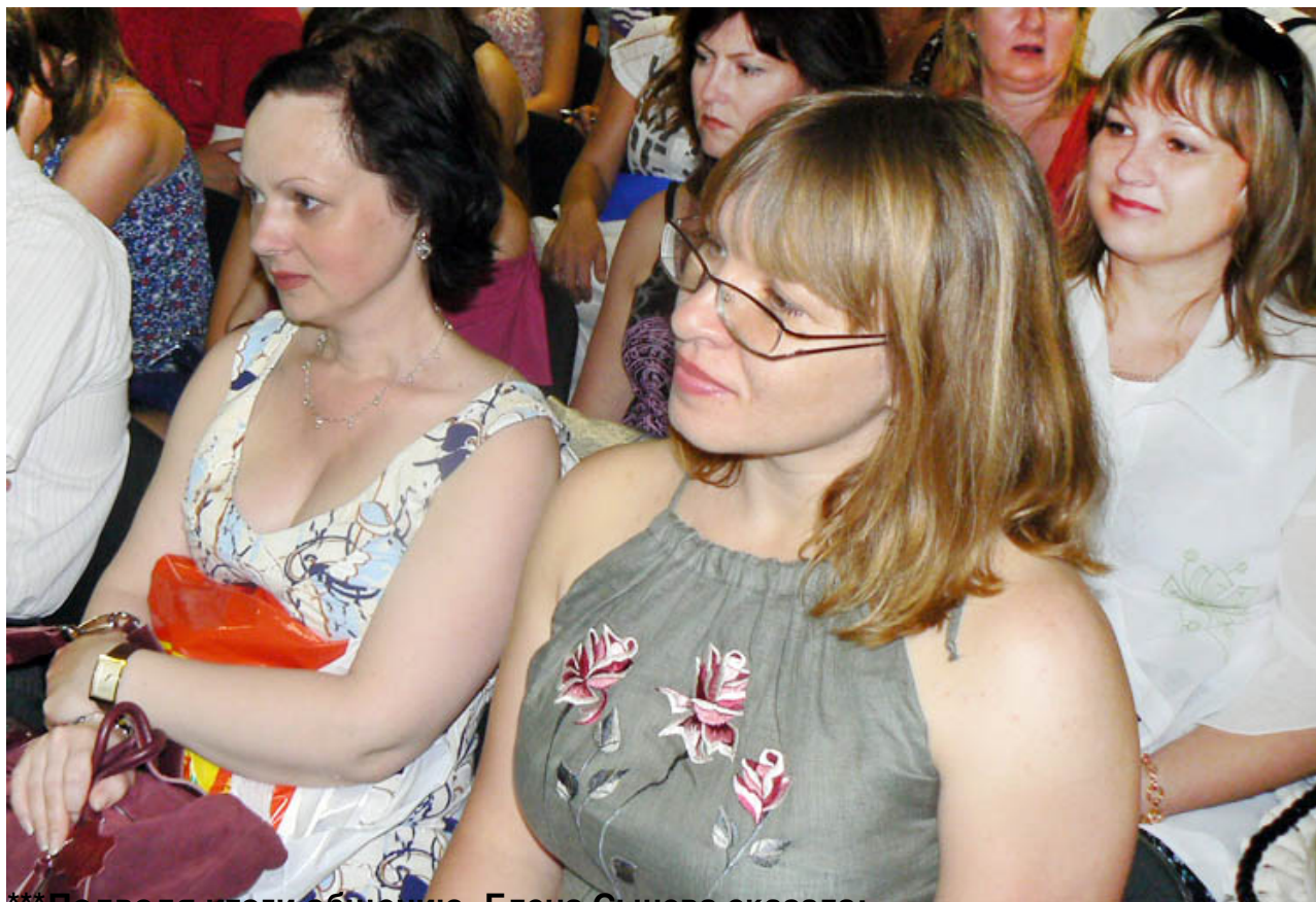
*** Попривітання з об'єднанням Елеон Сидорук сказав: