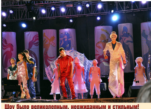
Шоу было великолепным, неожиданным и стильным!