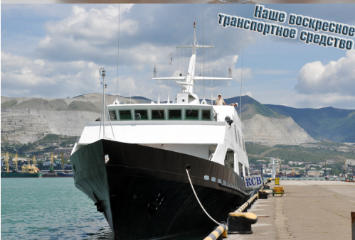
Наше воскресное транспортное средство