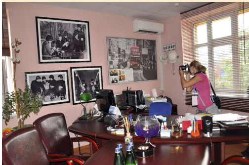
Кабинет руководителя НЗТ нас совсем не удивил. Ведь наверняка в кабинете руководителя транспортного терминала в Лондоне мы найдем портреты ВИА «Веселые ребята» и виды Москвы