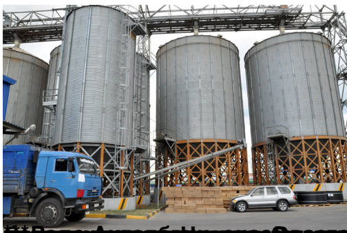
Журналистов встречало руководство

02.07.2012 04:26