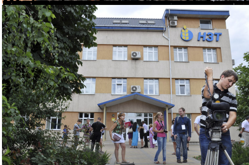
Экскурсия для журналистов на Новороссийский зерновой терминал - предприятие, входящее в Группу НМТП