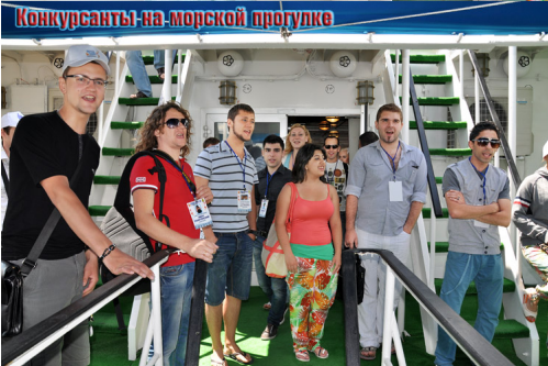
Конкурсанты на морской прогулке