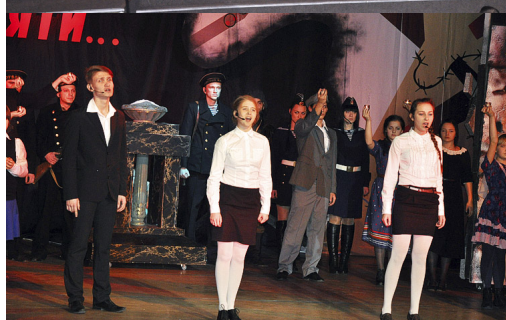
За первую часть мероприятия - патриотическую постановку - отвечал режиссер Олег Кузин