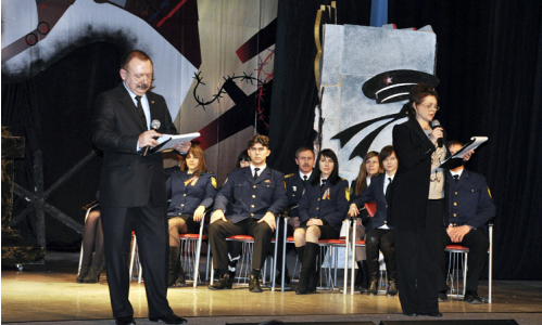
8 февраля 2013 г. Морской культурный центр