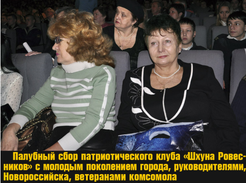
Палубный сбор патриотического клуба «Шхуна Ровесников» с молодым поколением города, руководителями, Новороссийска, ветеранами комсомола