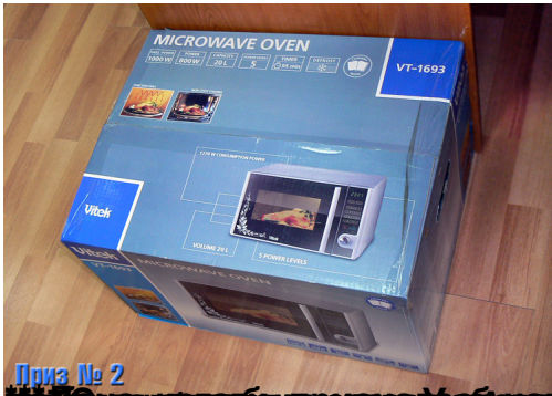
Приз № 2

Автор: Текст: Марина ЭКСТЕР, Владимир ДАРКИН, фото: Марина ЭКСТЕР 14.05.2011 12:35