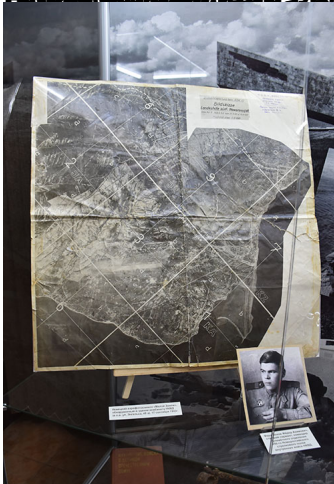
Карта района Новоросток, составленная в 1945 году. В центре — место высадки десанта НКВД