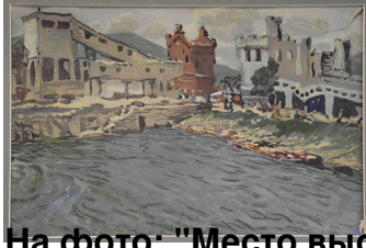
На фото: "Место высадки десанта НКВД" Катцев К.Я.