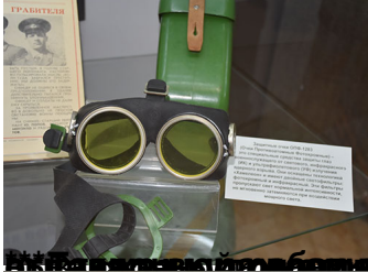
Оборудование десантников НКВД, использовавшееся в боях за Новоросток