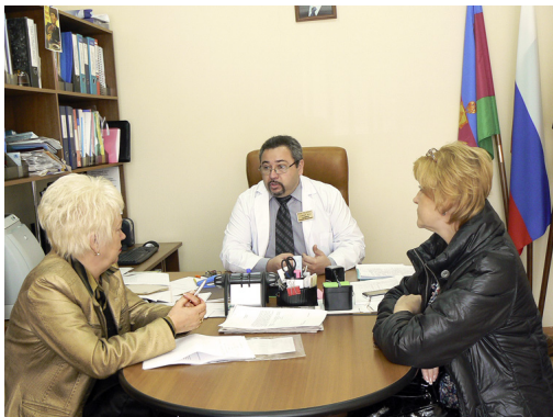
Слева - председатель комитета городской Думы Новороссийска