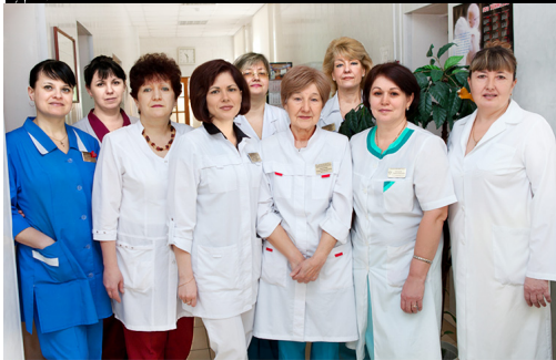
Сотрудники гинекологического отделения