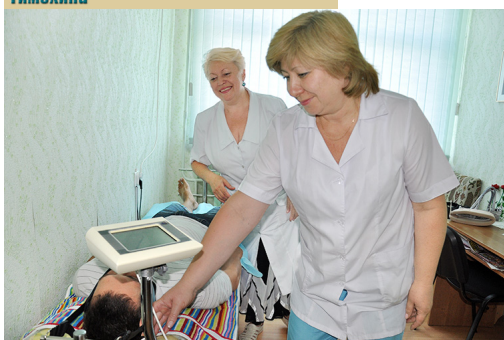
В кабинете мануальной терапии