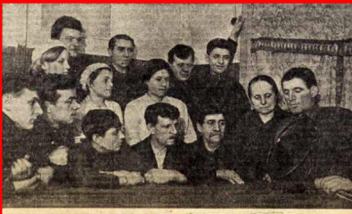
В объединенном Пятигорском заводе имени Л. М. Катышева рабочие слушают по радио обличительное заседание по делу истопника-журналиста-пролетария Копылова. Фото: Л. Копылов

Автор: nnn.ru, novodar.ru, новороссийские фото: Марина ЭКСТЕР 30.10.2012 21:40