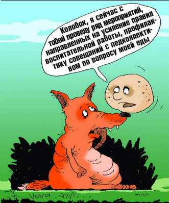
Коплюбок, я сейчас с тобой проведу ряд мероприятий, направленных на усиление пропаганды воспитательной работы, пропагандистку совещаний с перидоллективом по вопросу моей еды