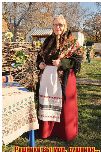
Рушники вы мой, рушники...